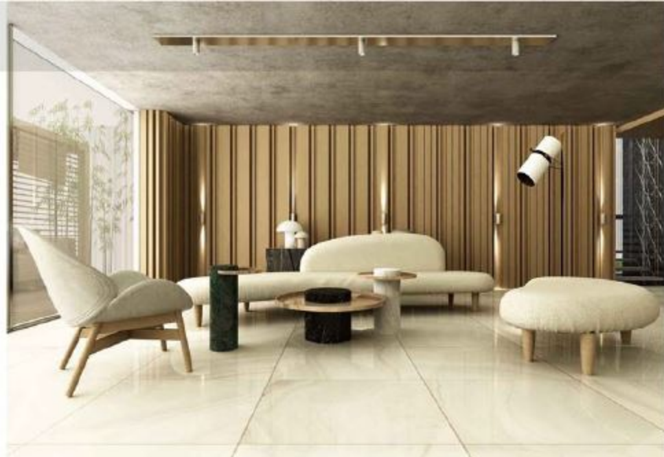
LOBİ VE RESEPSİYON