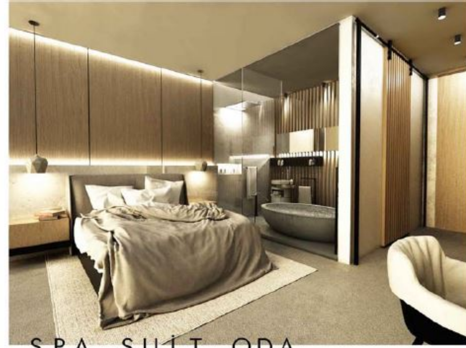
SPA SUİT ODA