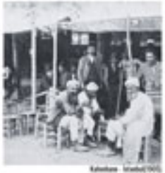
Kahvehanesi İstanbul (1911)

UNESCO tarafından 2013 yılında İstanbul'da kurulan Kahvehanesi, Türkiye'nin ilk kahvehanesidir. Kahvehanesinin sosyal hayatı ve kültürü yansıtan bir alan olarak kabul edilir.